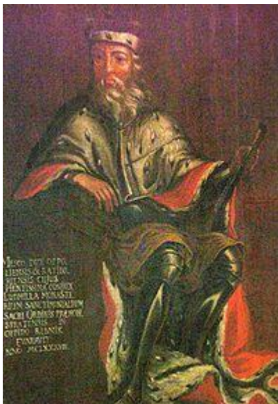
Mieszko I Płatonogi

Mieszko I Płatonogi (ur. 1131-1146 , zm. 16 maja 1211 ) – od 1163 formalny współrządca Śląska , od 1172 księżę raciborski , od 1201 opolski , od 1210 krakowski .